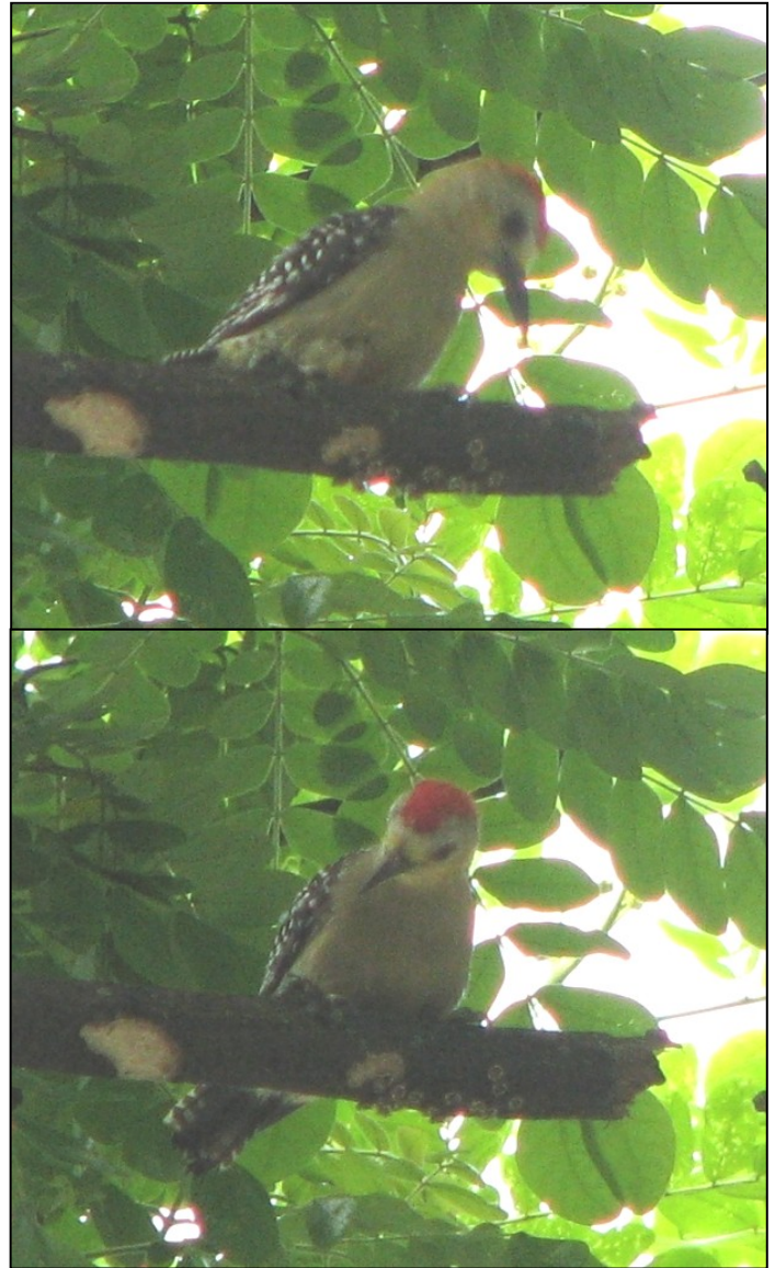
Figura 2. Carpintero Habado ( Melanerpes rubricapillus ) fotografiado forrajeando en las ramas de Samán sobre la Calle Quinta, al sur de la ciudad de Cali, Valle del Cauca.

al polluelo se encontraban hormigas, homópteros y larvas de diferentes grupos de insectos. En algunas ocasiones se observó a los adultos alimentarse de néctar de flores de Tulipán Africano ( Spathodea campanulata ) y luego dirigirse al nido.