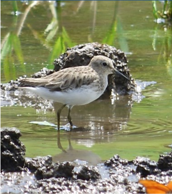
Figura 2. Correlimos diminuto ( Calidris minutilla ) en el río La Vieja, Quindío, Colombia.

posteriores visitas a la localidad no fue posible la observación de la especie.