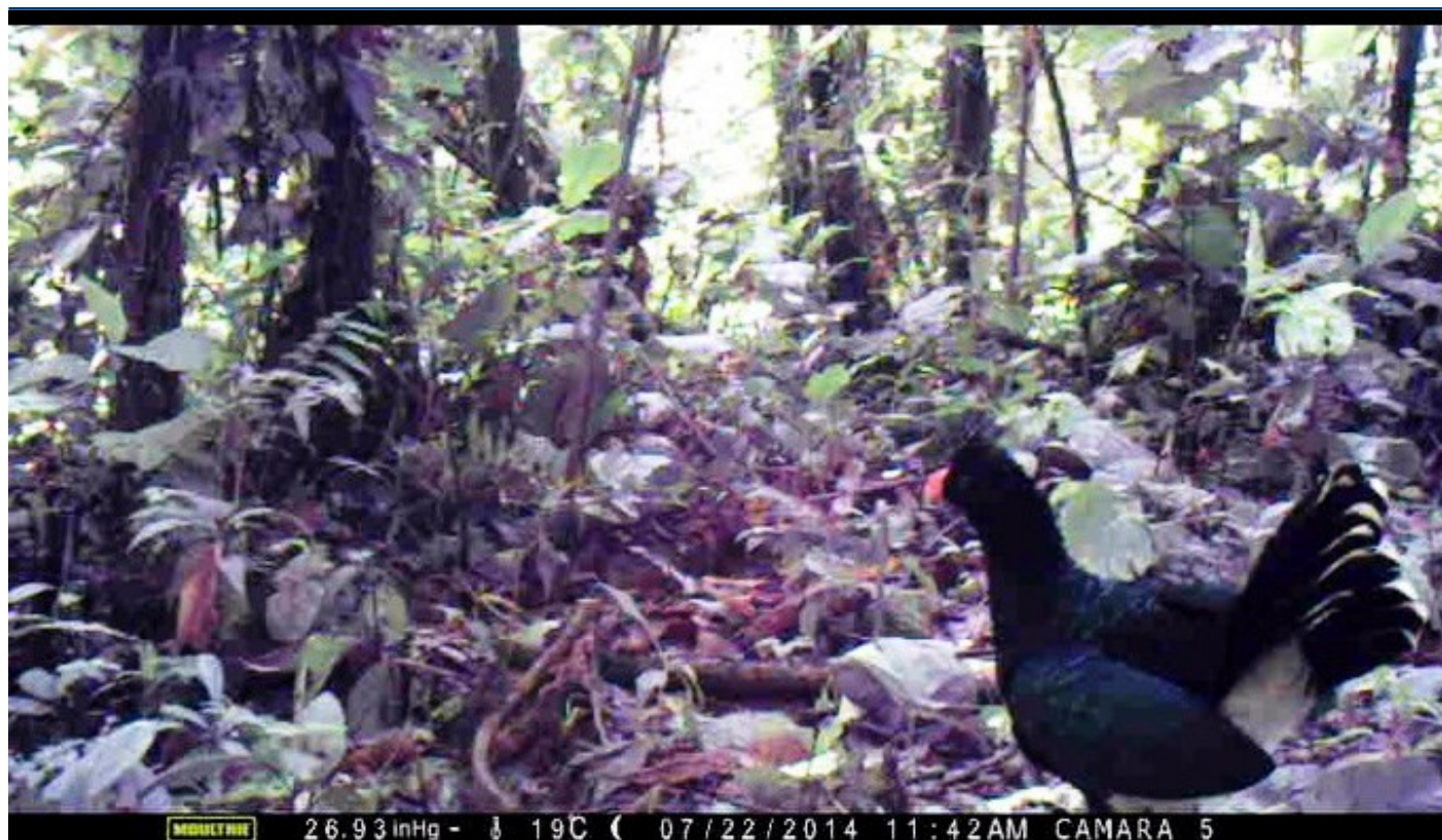
Figura 2. Fotografía extraída del video del individuo de Mitu salvini registrado dentro de la Reserva Maycú, Nangaritza, Zamora Chinchipe. (Video completo: hbw.com/ibc/1411948 )

incluyen a Mitu salvini , por lo que el inventario de aves de esta cuenca todavía es incompleto.