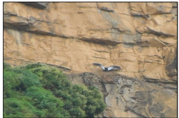
Figura 2. Macho con las alas extendidas, la hembra permanece debajo del macho aunque no es notoria.

Citación: PEÑA-PEÑA, L.A., E.A. GUERRERO, F. CIRÍ-LEÓN & J.J. CAGUA. 2020. Comportamiento de una pareja de cóndores ( Vultur gryphus , Cathartiformes), vereda Tencalá: Andes nororientales de Colombia. Ornitología Colombiana 18(i):e:01.