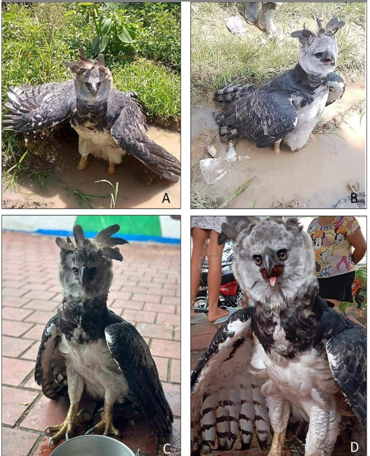
Figura 1. Registros fotográficos de una hembra adulta de Águila arpía ( Harpia harpyja ) encontrada en el corregimiento La Trinidad, municipio de Convención, departamento de Norte de Santander, Colombia. El ave al momento de ser hallada (A) y (B). Detalle del animal durante su paso por el corregimiento La Trinidad (C y D).