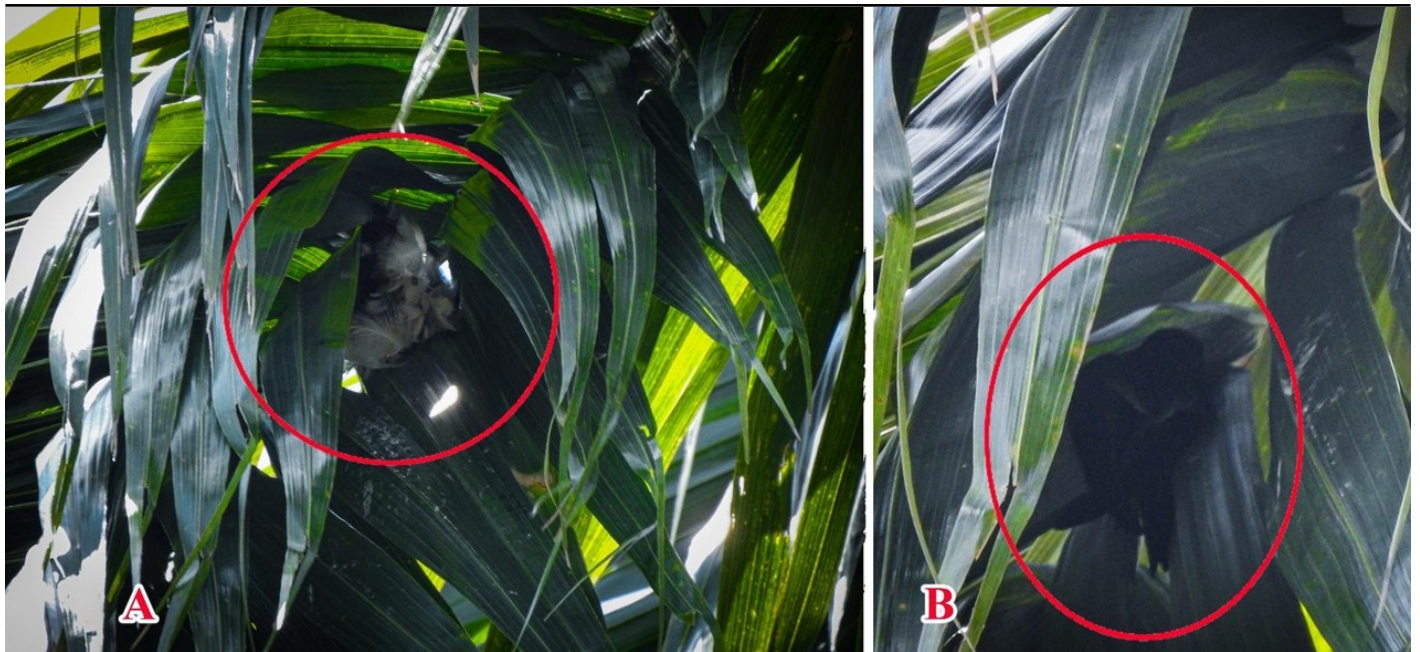
Figura 4. (A) Nido de Tachornis furcata , en las hojas de una palma del género Roystonea , se destacan plumas blancas en la estructura principal (B) Un individuo de T. furcatus posado entre las hojas de una palma. Al cerrar las alas, se evidenció una característica visual distintiva: en la parte posterior de las alas plegadas se observa una marca que simula una franja o raya. Las plumas presentan puntas angostas, pero notoriamente blancogrisáceas, especialmente las dos más proximales y sus coberteras mayores, las cuales contribuyen a la apariencia de una línea blanca en el ala al estar plegada (Sutton 1928).

biogeográficos futuros. Estos hallazgos resaltan el valor de regiones históricamente subexploradas y la importancia del trabajo de campo sostenido para redescubrir especies consideradas raras o poco comunes. En este contexto, las observaciones aquí presentadas aportan información relevante para la evaluación nacional del riesgo de extinción, dado que la especie se encuentra actualmente catalogada como Datos Deficientes (DD) (Arzuza & Devenish 2016).