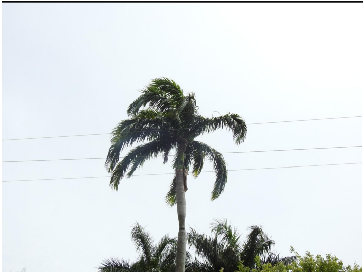
Figura 3. Palma del género Roystonea , donde se encuentra el nido: Fotografía: Alberto Peña.

Durante sus visitas al sitio de nidificación, los individuos transportaban plumas en el pico, un comportamiento que coincide con lo descrito por Collins et al. (2010). El nido estaba ubicado aproximadamente a 10 metros de altura y era fácilmente visible cuando el viento movía las hojas, lo que permitía observar la entrada y salida de los individuos adultos. El nido era una formación colgante de color marrón con muchas plumas adheridas a este, donde permanecía suspendido y oculto dentro de las hojas de la palmera (Fig. 4-A).