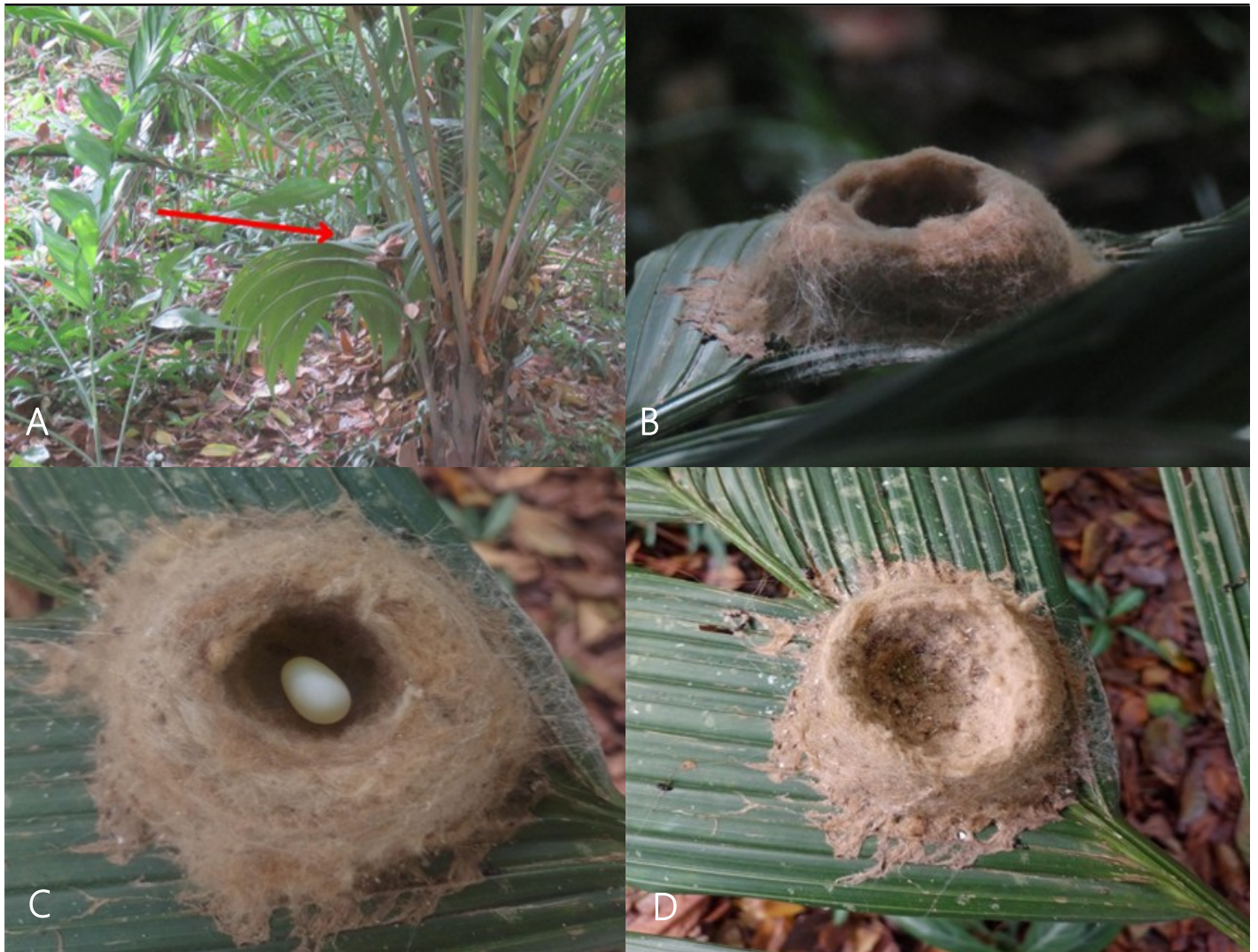
Figura 2. Nido de Colibrí nuquiblanco ( F. mellivora ) (A) Ubicación del nido sobre la hoja de palma ( W. radiata ) indicado por la flecha roja (B) Detalle lateral del nido (C) Vista dorsal del nido cuando fue encontrado (D) Vista dorsal del nido cuando salieron los volantones.

de vuelo (Fig. 4D), las cuales empezaron a determinar la morfología externa del plumaje, en cabeza, cuello y tórax; con una coloración predominantemente negra a verdosa en las alas y cola con terminaciones blancas. Las plumas coberteras que son las que se sitúan en la base de las plumas de vuelo (las remeras), se desarrollaron en los polluelos 6 días después de empezar la muda (Fig. 4E); a la vez que manifestaron algunas plumas azules en la cabeza y verdes en el cuerpo, semejantes a la coloración distintiva de los adultos, pero con áreas muy claras de plumas aparentemente lisas, que se extienden desde la parte anterior de la espalda hasta las coberteras caudales, y que finalizan en una coloración gris hacia las puntas (Fig. 4F).