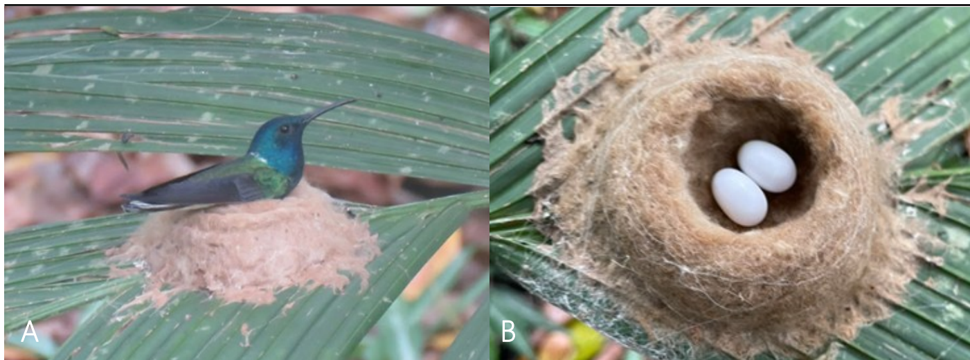
Figura 3. Incubación por hembra androcromática de Colibrí nuquiblanc ( F. mellivora ) y huevos ( A ) Hembra observada en proceso de incubación de huevos ( B ) Huevos presentes en el nido.

reproductiva del nido observado coincide con el pico reportado para F. mellivora , entre diciembre y marzo (Skutch 1973, Stiles et al. 2020, Falk et al. 2025), así como con el tiempo de incubación estimado de 19–20 días (Stiles & Skutch 1989). Estas observaciones concuerdan con los registros de nidos activos en eBird (2025). No obstante, se requiere mayor seguimiento para determinar si la especie presenta un periodo reproductivo más extenso en la región central de Colombia (eBird 2024) y en el suroeste de Costa Rica (Skutch 1973), hasta los meses de junio y julio.